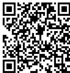
Рис. 2. QR-код Google формы для ответов на квест “#ВЛес”

КП 40. На КП заранее сооружена «лисыя нора». Ребята должны распознать ее и сделать фото максимально приближенной к описанию в задании. Фото ребята должны выложить в Инстаграм, отметив учреждение, проводящее квест.